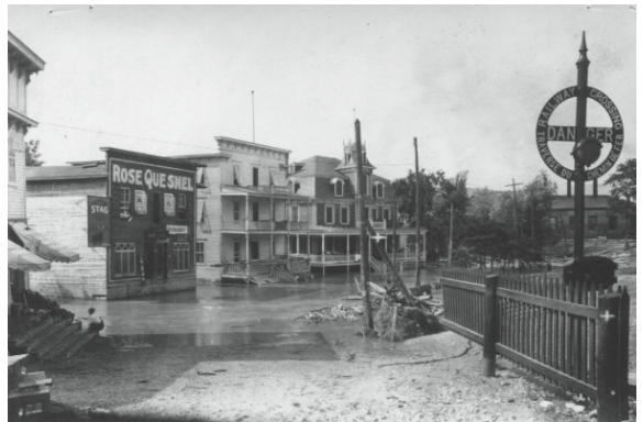
1917 : Avard & Nadeau, restaurant-barbier, hôtels Larochelle et Manoir Bilodeau