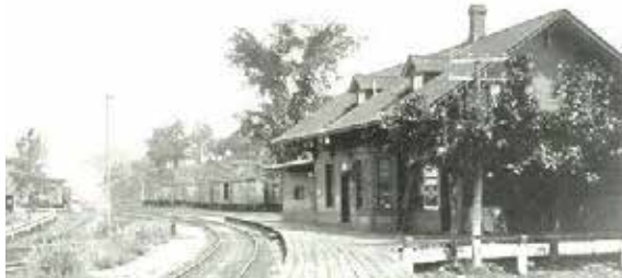
La première station du Levis & Kennebec Ry avec la QC-42 vers 1914