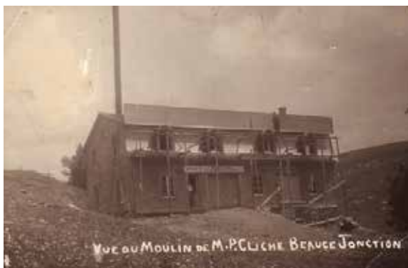
La manufacture de brosses & balais de Philibert Cliche sur la rue Morency en septembre 1910

Pourquoi autant de commerces et d'industries dans une si jeune village? Il faut dire que l'un de nos tout premiers conseils municipaux avait fait adopter une importante résolution, appuyée par l'ensemble des concitoyens, donnant une exemption de taxes à toutes les nouvelles industries pour une période de 20 ans!