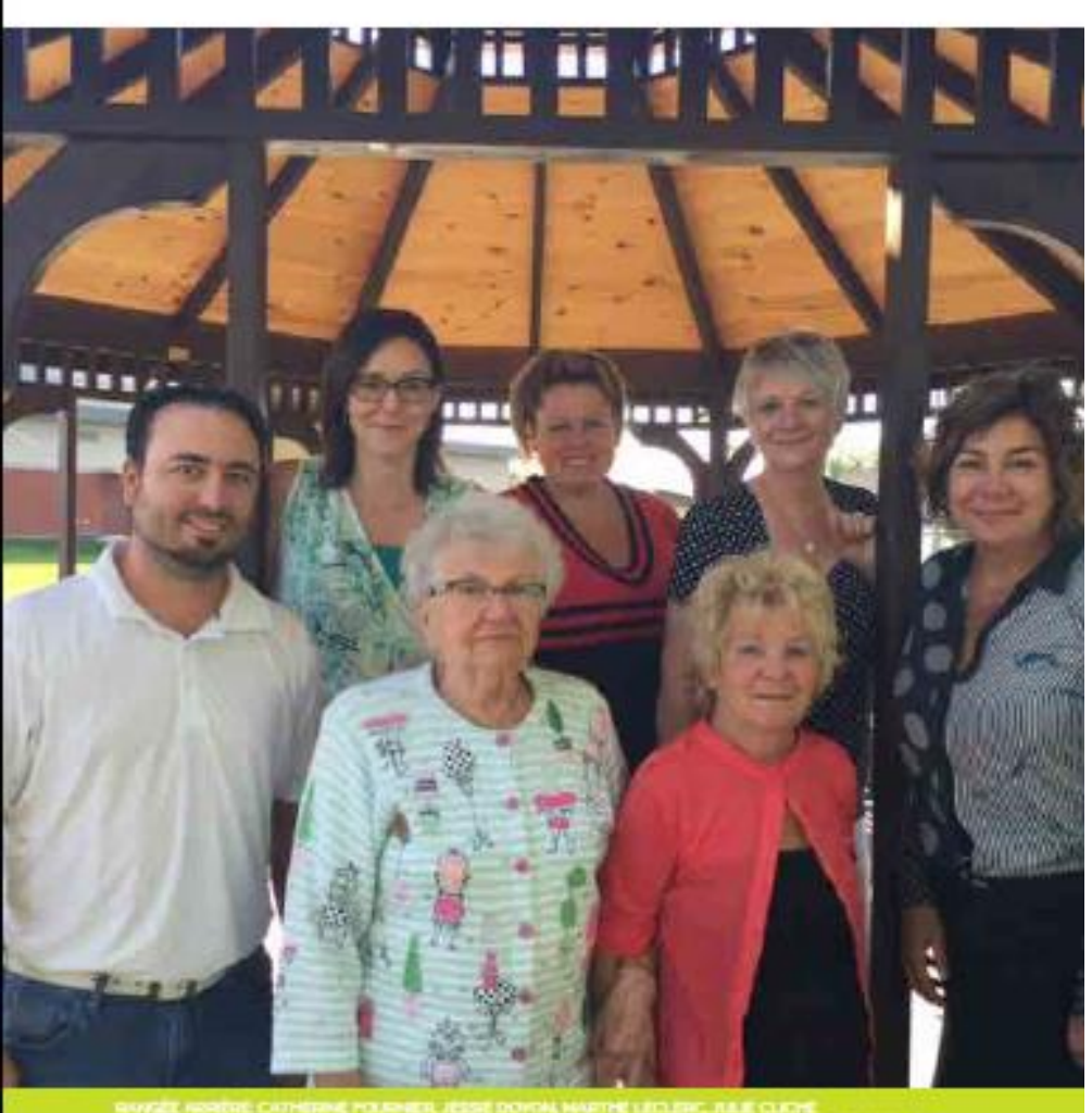
GRANGE HORERS CATHERING POLICHER, 1955E DOVICAL MARTHE LIFICERS, JALIE CLICHE SANGE HAWIT VINCENT VACHOR, CARNER VERLEICK WOTHE DOVICH BRUIL-HORER GROEFER ARESTM